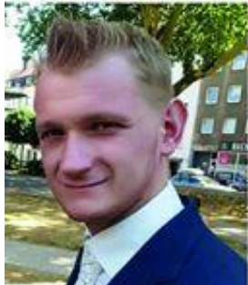
Oliver Bruskolini Autor